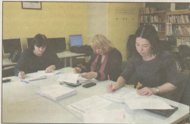
Dirba geografijos olimpiados vertinimo komisija.